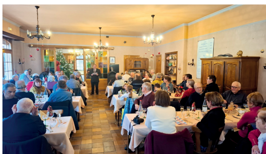
Près de 70 personnes ont assisté à la traditionnelle fête de Noël des aînés le 7 décembre