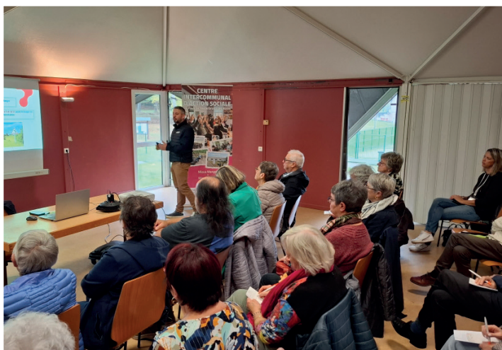
Conférence sur la conduite des séniors, proposée au Mille Club par la Com Com pour le mois des aînés