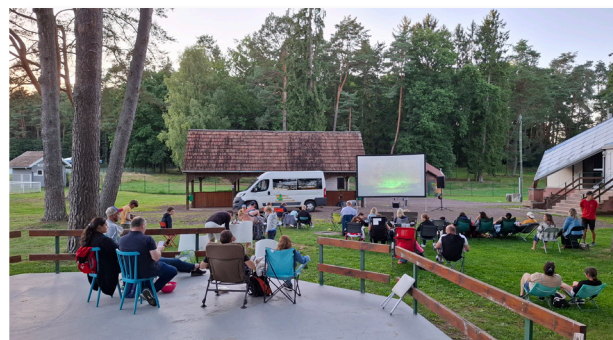
Le 7 août, c'était soirée cinéma du RAI avec la projection du film Le dernier jaguar