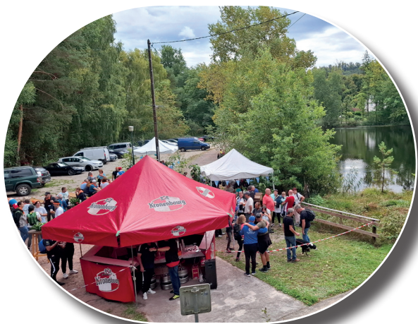
Près de 500 personnes ont participé à la marche gourmande organisée par l'INAS le 21 septembre