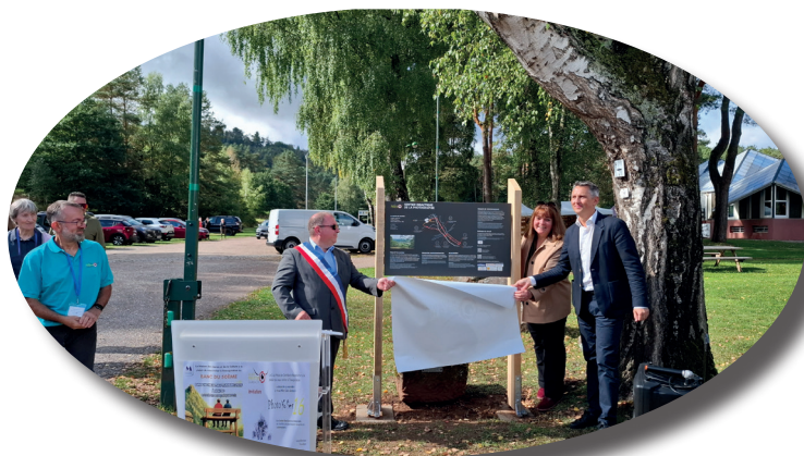
Inauguration du sentier didactique de la photographie, long de 5 kilomètres au départ du Mille Club, le 14 septembre dans le cadre des Photo'folies 16