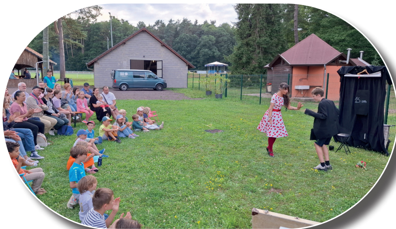
102 spectateurs ont assisté au spectacle A la renverse, je suis tombée, organisé le 31 juillet par Réseau Animation Intercommunale dans le cadre du festival Mômes en scène