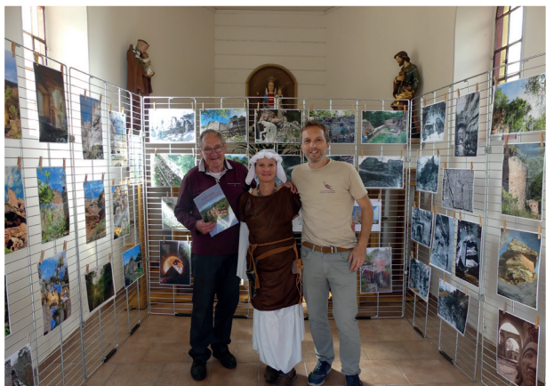
L'association Cun Ulmer Grün qui restaure les ruines du Schoeneck était présente à la chapelle Notre Dame des Champs à l'occasion des Photo'folies 16