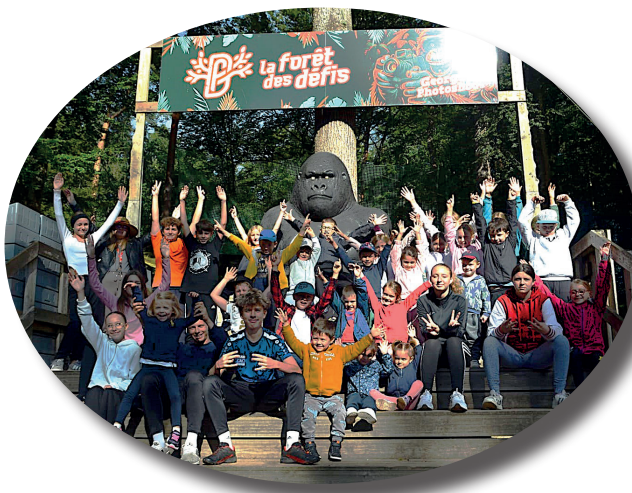
Sortie dans la " Forêt des défis " à Bitche, offerte à une trentaine d'enfants par les Co-pains de la vallée en septembre