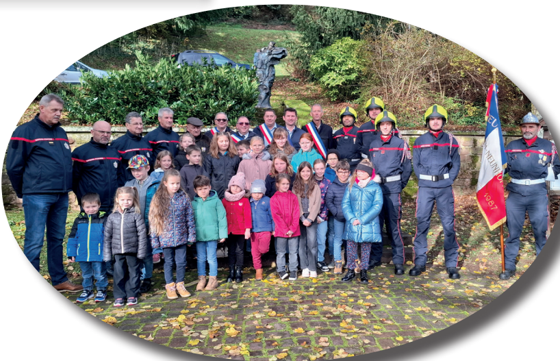
La cérémonie commémorative intercommunale du 11 novembre à Windstein, avec une très belle interprétation de la Marseillaise par les enfants de l'école