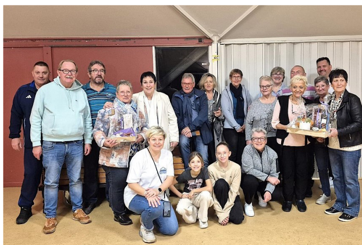
Dans le cadre de la soirée Jeux en famille du RAI le 10 octobre, les Copains de la vallée ont réuni une vingtaine de joueurs de belote