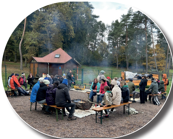
Le Speckfescht du F C Dambach Neunhoffen a réuni plus d'une centaine de personnes le 26 octobre