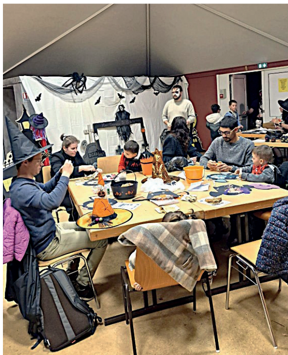
Halloween : avant le défilé et le sentier de l'horreur, les Copains de la vallée ont proposé aux enfants un atelier bricolage le 31 octobre