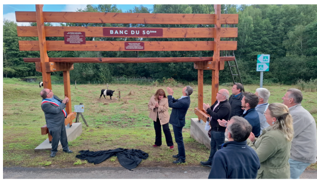
Un banc pour les 50 ans de la MJC, inauguré le 14 septembre