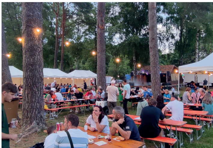
Grand succès pour le week-end messti organisé du 5 au 7 juillet par le F C Dambach Neunhoffer

Coup de projecteur sur quelques événements qui se sont déroulés dans notre commune au cours du 2 ème semestre 2025