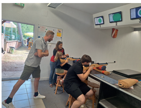
Les visiteurs sont venus en grand nombre au stand de tir à Neunhoffer à l'occasion des portes ouvertes le 24 août