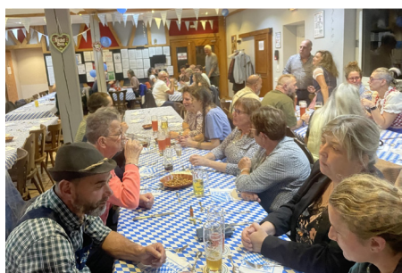
Première fête de la bière, premier succès pour l'association de tir le 11 octobre