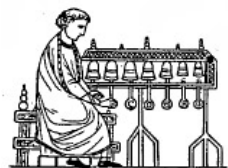
Carillon (XIII e s.).